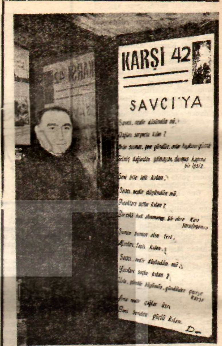
Şahir Fazıl Hıncal Dağlarca, «Horoz» adlı şiirinden dolayı kovuşturulmaya uğradı. İlk tahkikatın gizliliğine ilişkin kanunî hükümleri dolayısıyla, soruşturmanın sonuna dek bu konuda yazmayacağı. Resimde Dağlarca ve sergilediği şiiri görülüyor.

Bu kararda özellikle a) Hangi sektörlerde yabancı sermayenin kabul edileceği, b) Fazla kapasite tanımları, c) İhracata yönelme yolları belirtilecektir.